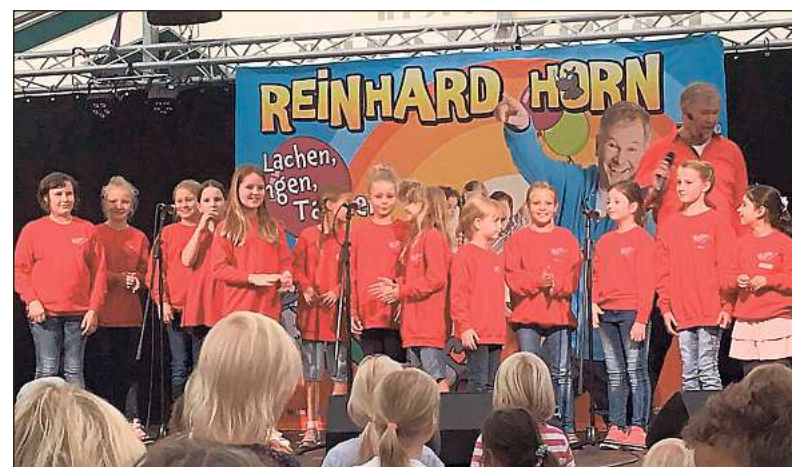
Die Diestedder Chorkids gestalten am Samstag ab 17 Uhr die Vorabendmesse zur Einführung der neuen Messdiener musikalisch mit. Auch andere Kinder ab sechs Jahren können dabei mitmachen. Deshalb bieten die Chorkids am Samstag von 14.30 bis 16.30 Uhr eine offene Probe im Karl-Leisner-Heim. Zwischendurch gibt es Plätzchen und kalte Getränke zur Stärkung.