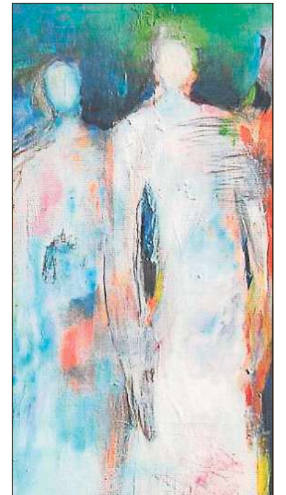
Engel und Frauen gehören zu den Lieblingsmotiven der Malerin und Kunsttherapeutin.