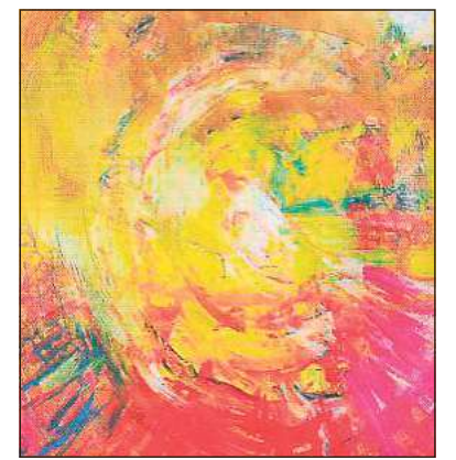
Die Energie von Farben spielt in den Bildern eine große Rolle.