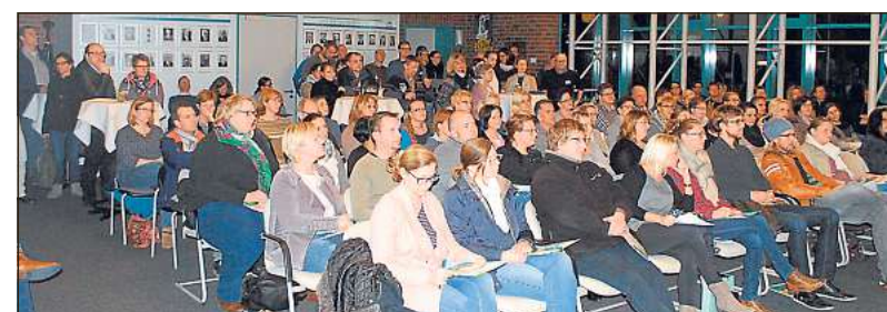
Im Rathaus informierten sich zahlreiche Eltern über die Möglichkeiten ihrer Kinder zum Schulwechsel.